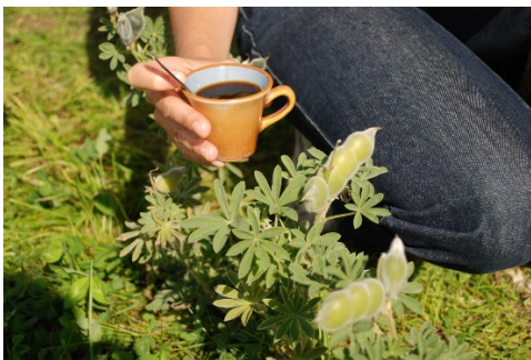
Voltruiert Kaffee